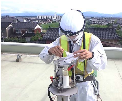
防災関連／技術スタッフ