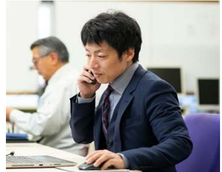
防災関連／営業スタッフ

地域の防災・減災のために、洪水災害や土砂災害に備え「降水量や河川水位」などを観測し、そのデータを国土交通省や県市町村に提供しています。