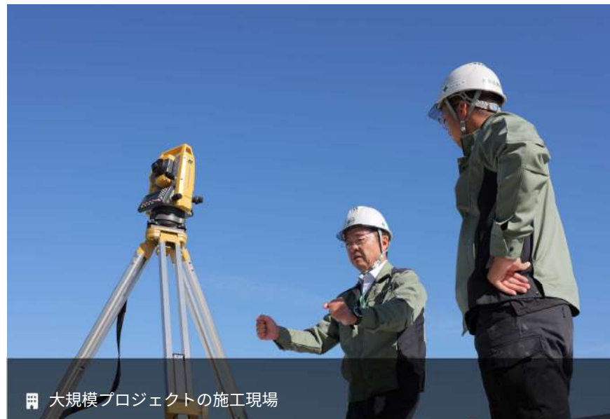
大規模プロジェクトの施工現場

長年にわたる強固なパートナーシップで、安定した施工体制を構築。信頼できる協力会社と共に、高品質な物づくりを実現しています。