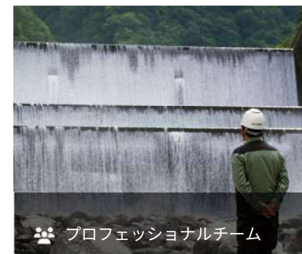
プロフェッショナルチーム