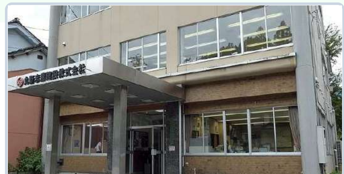
本社外観イメージ