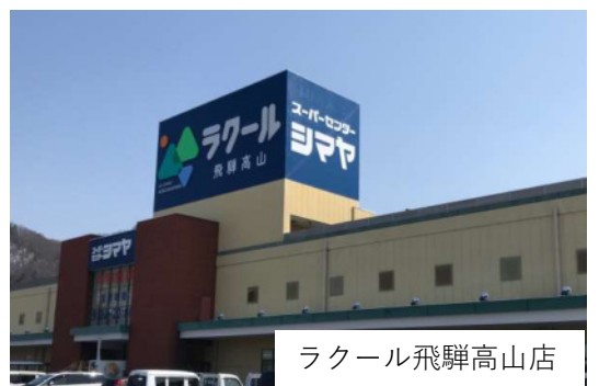
ラクール飛騨高山店